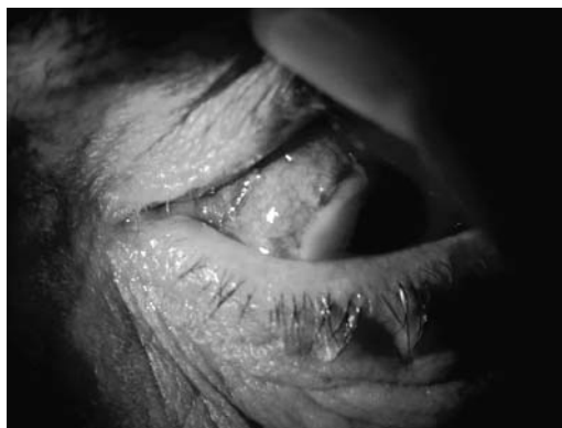
Fig. 1: Infiltrado corneal extenso con descematocele central, limbo perilesional avascular e inflamación conjuntival intensa.

Ante la sospecha de perforación corneal secundaria a una necrosis vs absceso esclero-corneal, se tomaron muestras para estudio microbiológico y se le intervino de urgencia mediante recomposición de la cámara ante-