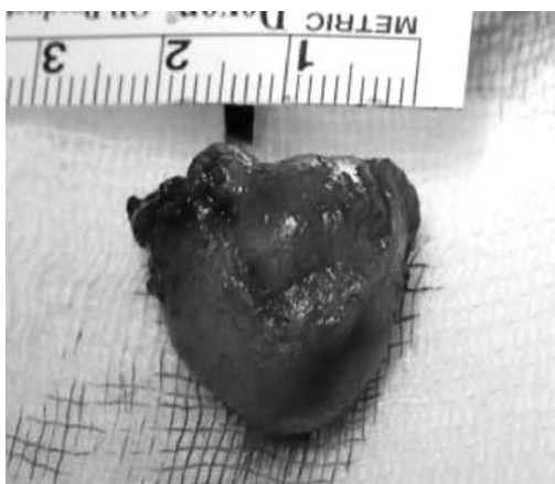
Fig. 4: Tumoración de 20 x 15 mm de consistencia semifirme (meningioma fibroblástico).

En la actualidad, tras 4 meses de la intervención quirúrgica, la evolución ha resultado satisfactoria, sin mostrar evidencias de recidiva. La AV en OD ha mejorado progresivamente hasta ser de 1, con desaparición de la tumoración palpebral, sin evidenciar altera-